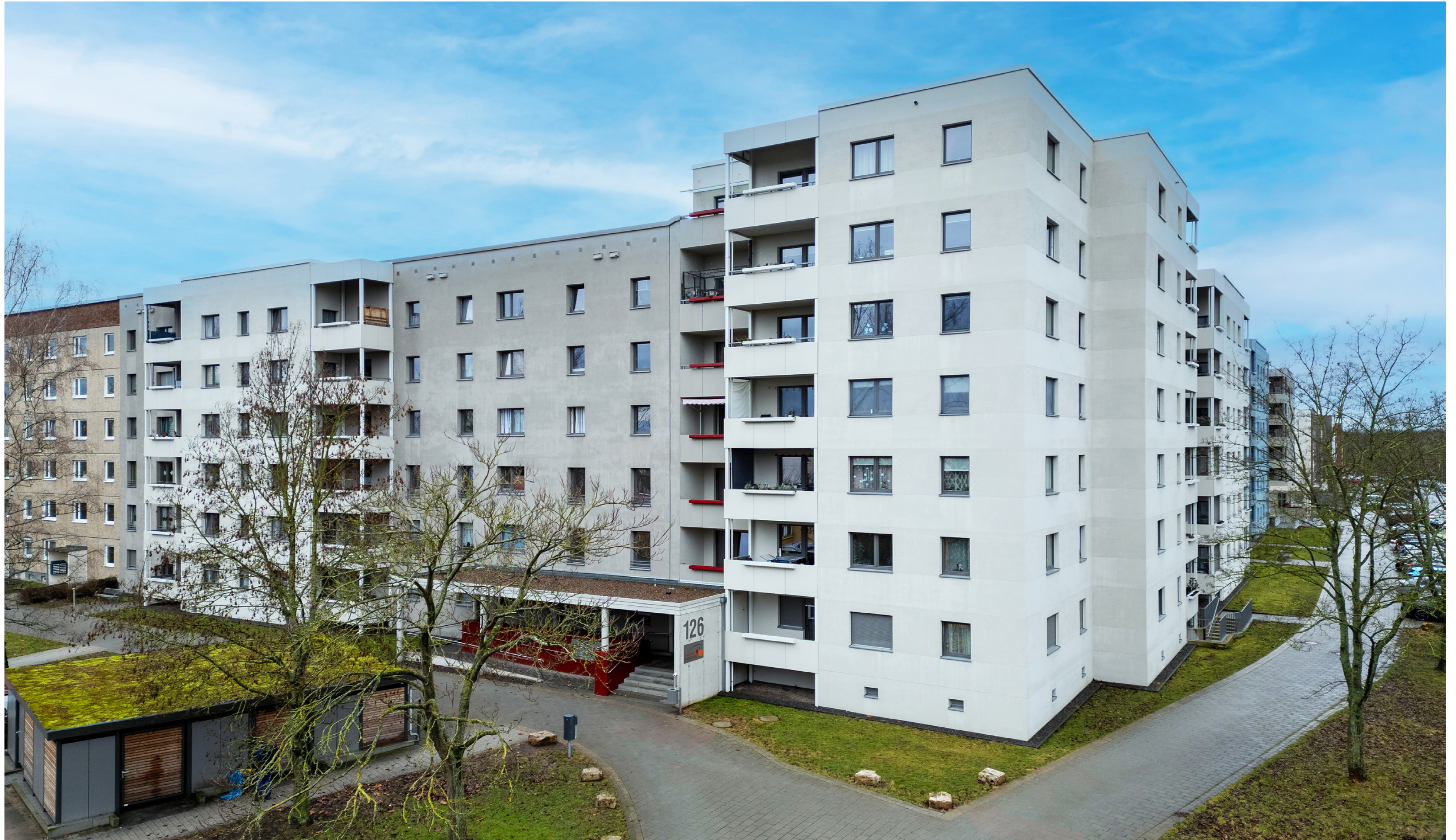
Außenansicht Nr. 126 nach Sanierung und Eckneubau