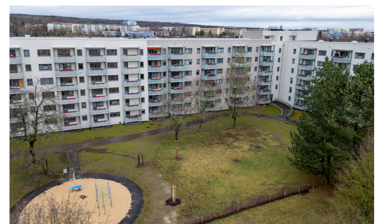
Großzügiger Innenhof mit Spielplatz