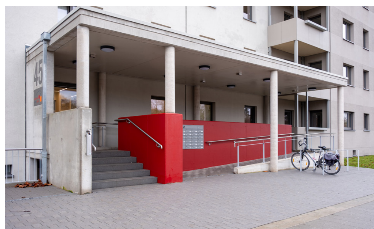
Hauseingang Nr. 45

Aus WBS-70-Einheitsplattenbauwohnungen sind auf ressourcenschonende Weise neu zugeschnittene, hochwertig ausgestattete, barrierearme, bezahlbare Wohnungen entstanden, die dem immer individueller werdenden Wohnbedarf entsprechen.