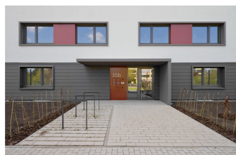
Zugang von außen