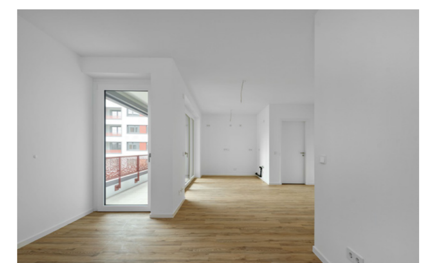
Wohn- und Küchenbereich mit Balkon, Beispielwohnung