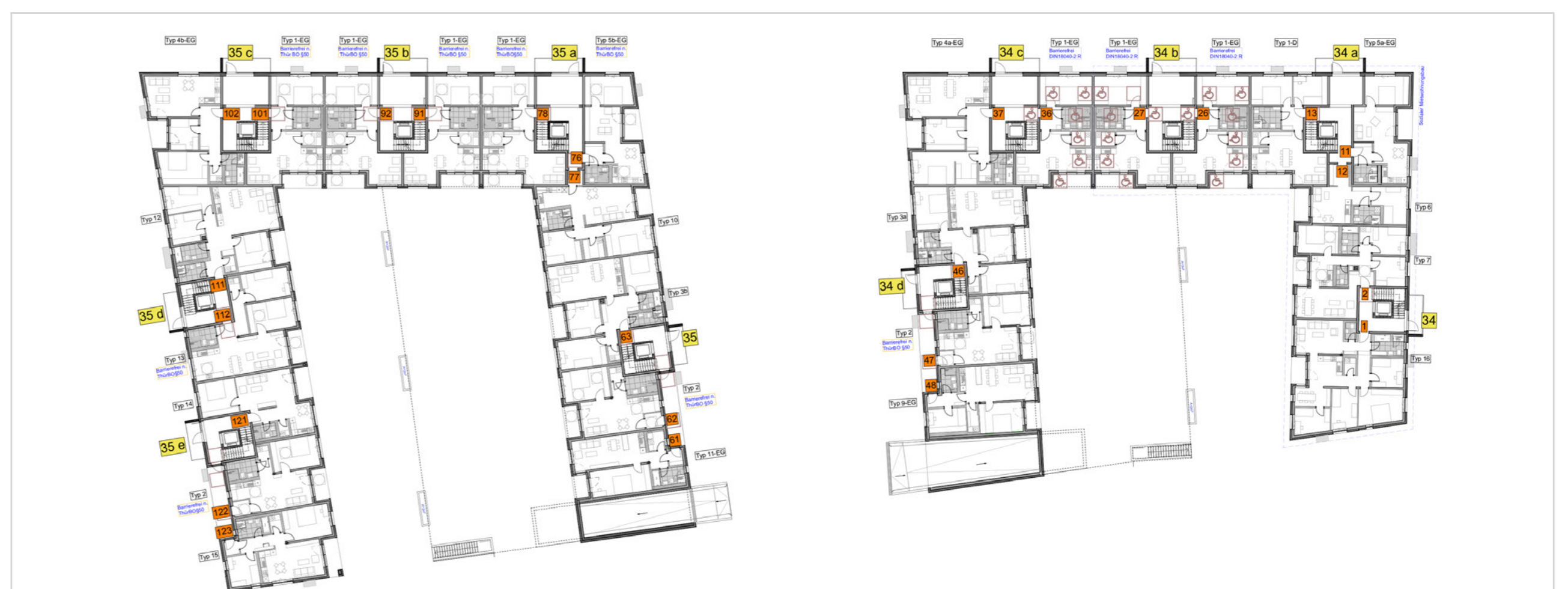
Grundrisse Erdgeschoss (links: Haus B 35–35e, rechts: Haus A 34–34d)