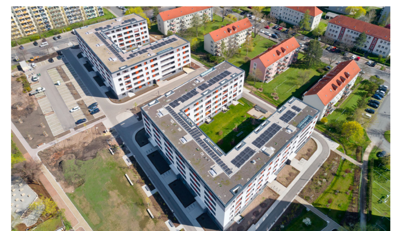
Luftbild aus 2022