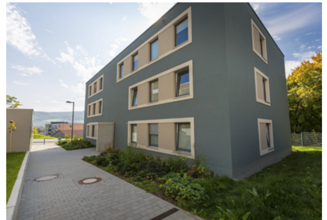
Naumburger Straße 161