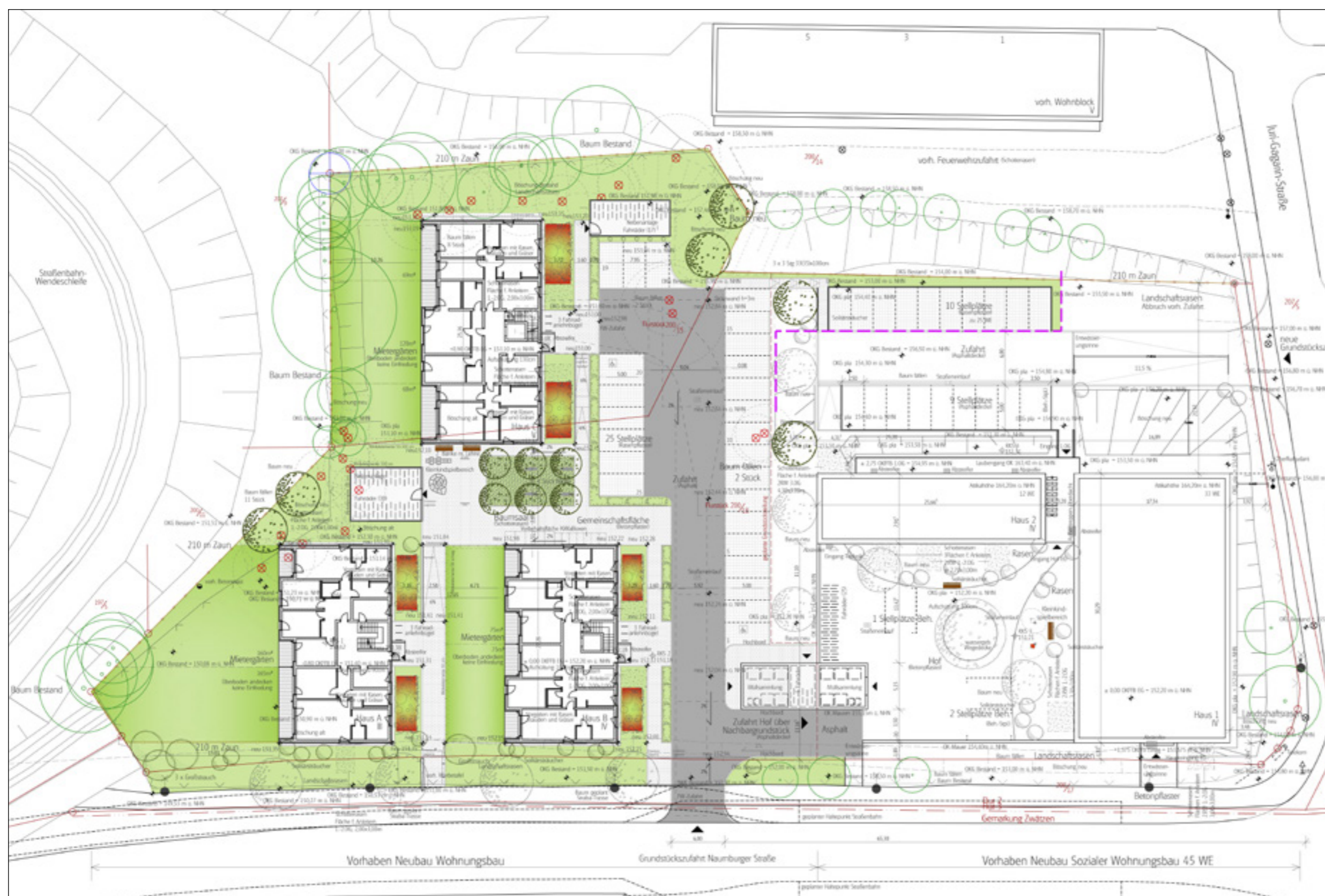
Lageplan | Plan: Nitschke+Kollegen, Weimar