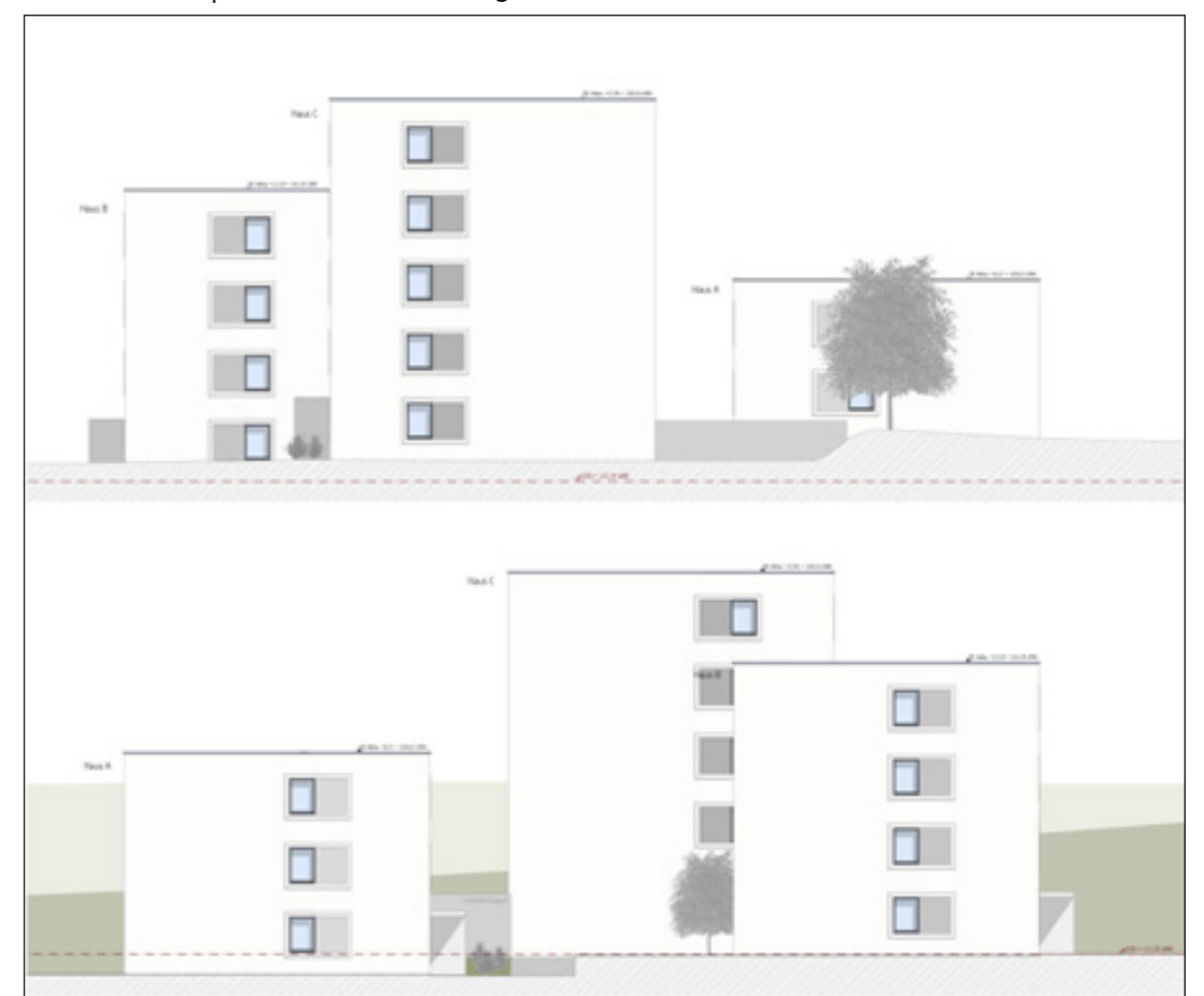
Ansichten Ost und West | Plan: Nitschke+Kollegen, Weimar