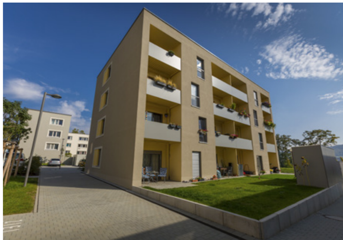
Ansicht Süd-Ostseite