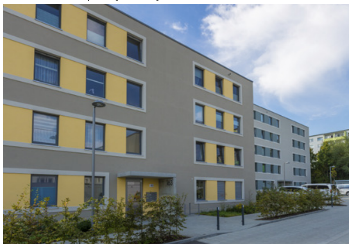
Ansicht Nordseite