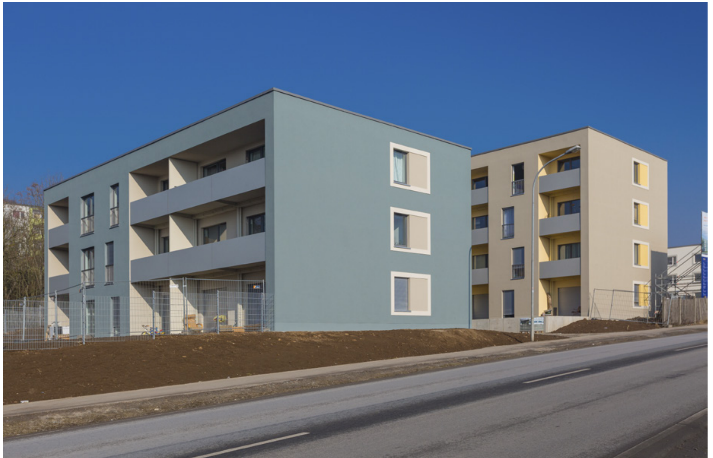
Ansicht Ostseite

generalplanendes Architekturbüro Nitschke + Kollegen Architekten GmbH, Weimar